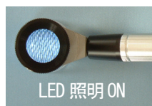
LED 照明 ON